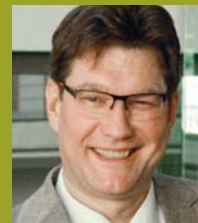
Uwe Heimowski Politikbeauftragter am Dt. Bundestag