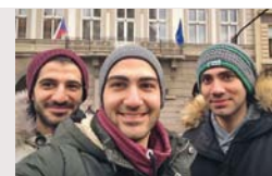
Band „Samras“ aus Aleppo, u. a. interkulturelle Musikgruppen